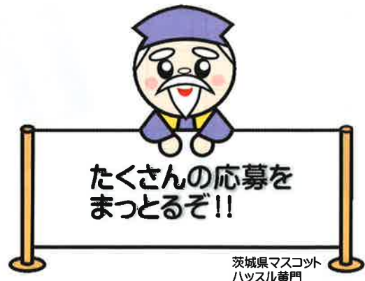
茨城県マスコット ハッスル黄門