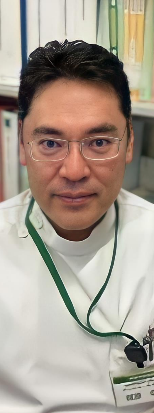
公益社団法人地域医療振興協会 伊東市民病院 作業療法士