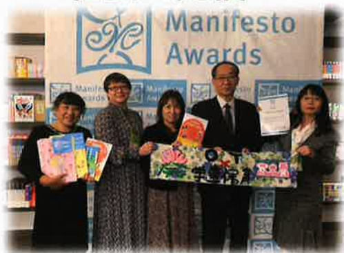
2019. 11. 日本マニフェスト大賞