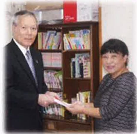
2019. 12 全労済より縄跳び寄贈