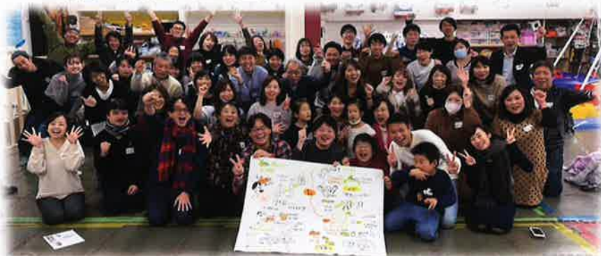
2019. 12 WAM助成事業 OT&学童指導員等交流会 in 湘南

【編集後記】学童保育施設の木造化、発達障害児等の支援のための作業療法士連携、オンライン研修の実施、災害対応…この数年を振り返ると、本当にいろんなことにチャレンジし、みんなの力で実現してきました。安心して「トライ&エラー」のできる環境。それが、学童保育であり、岡山県学童保育連絡協議会であると実感しています。指導員、保護者、運営者と多彩であり、さらに他職種も加わって、子どもたちを考える素晴らしい「場」。私たちのがんばりがどこかの街の子どもたちや指導員を支えてる！本当に嬉しい。みなさん、ぜひ、一緒に。（糸）